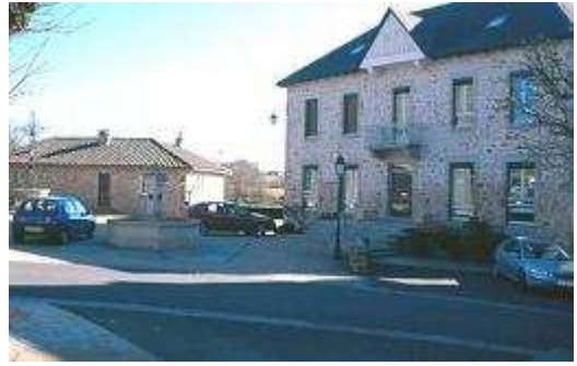
La mairie de Siran

Siran est une localité rurale située au Sud-Sud-Ouest du département du Cantal, au cœur du Pays Vert , tout au bout de l'Auvergne, au portes du Quercy, à la limite du Lot et de la Corrèze, au-dessus des Gorges de la Cère et non loin de l'Aveyron. Un grand choix de routes secondaires paisibles se faufilent dans un cadre encore préservé, de village en village, offrant aux amateurs de randonnée de nombreuses possibilités de pratiquer le vélo grandeur nature ainsi que la randonnée pédestre, et de découvrir des sites historiques et pittoresques.